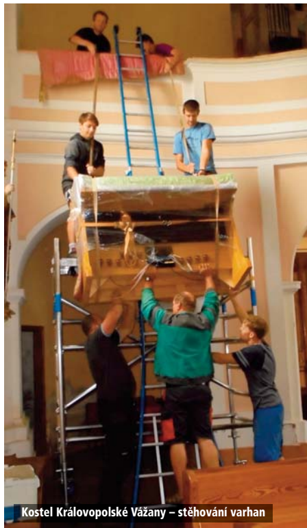
Kostel Královopolské Vážany – stěhování varhan