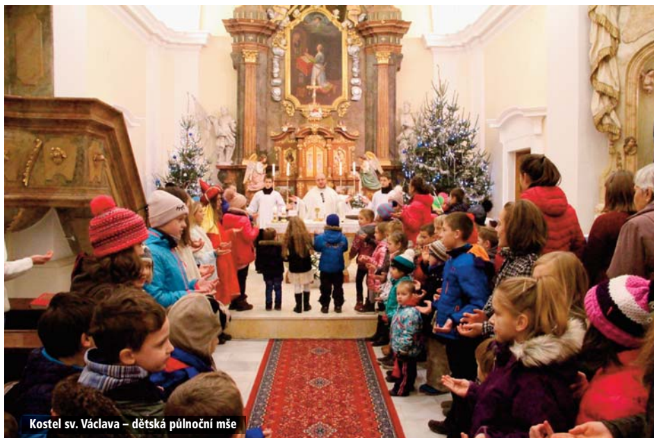
Kostel sv. Václava – dětská půlnoční mše

Prožili jsme Velikonoce a již bylo třeba se ►