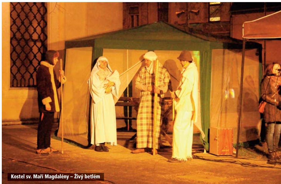
Kostel sv. Maří Magdalény – Živý betlém