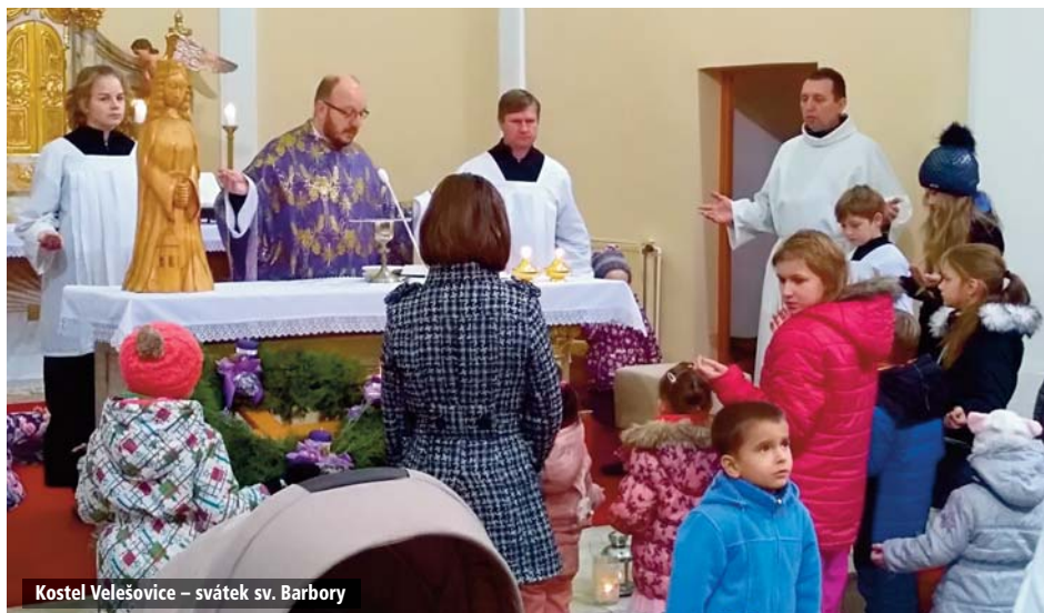
Kostel Velešovice – svátek sv. Barbory