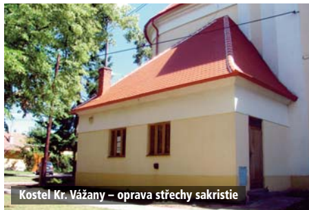
Kostel Kr. Vážany – oprava střechy sakristie

Pokud se podaří získat finanční prostředky i pro rok 2019, mělo by se pokračovat ve výměně oken věže a opravě fasády kostela, nejprve severní část (od silnice) a pak druhá strana kostela a čelní část kostela.