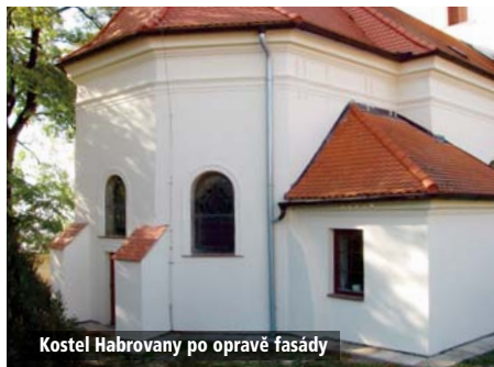
Kostel Habrovany po opravě fasády

V roce 2019, pokud se podaří získat dostatek finančních prostředků, bychom chtěli začít prá-