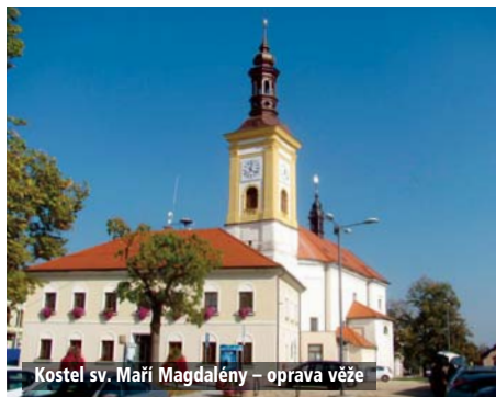
Kostel sv. Maří Magdalény – oprava věže

V roce 2018 pokračovaly opravy dokončením opravy věže kostela. Náklady na dokončení střechy byly cca 900 000 Kč. Dále se pokračovalo opravou fasády věže kostela a také celkovou opravou věžních hodin tak, aby věžní hodiny dostaly původní podobu, kterou se podle původních fotografií podařilo zjistit. Rovněž se řešila barevnost fasády kostela, aby se kostel více přiblížil původnímu barevnému kontrastu. Pro některé z nás byla tato nová barevná kombinace po demontáži leštění překvapením, ale myslím, že již jsme ji přijali za svou. Opravu fasády věže kostela prováděla