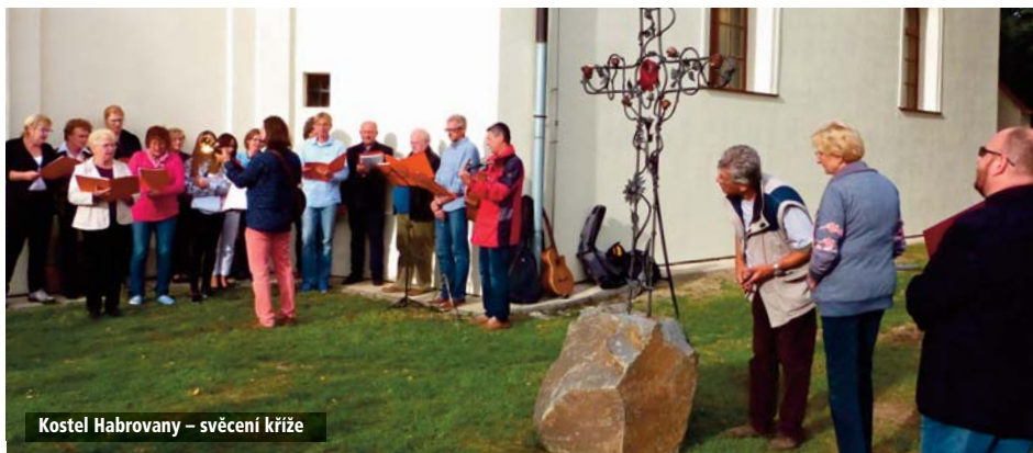
Kostel Habrovany – svěcení kříže